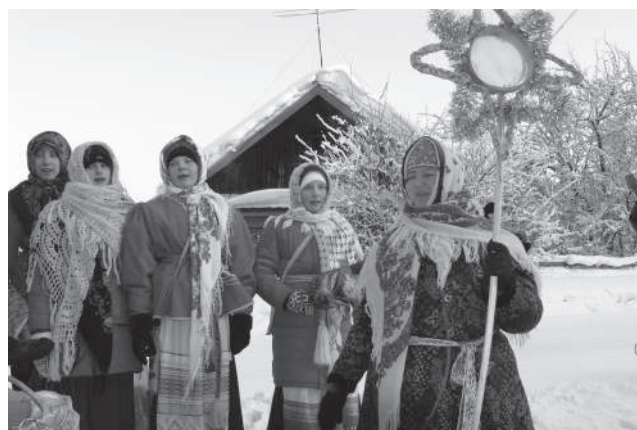
Образцовый фольклорный ансамбль «Тропина».